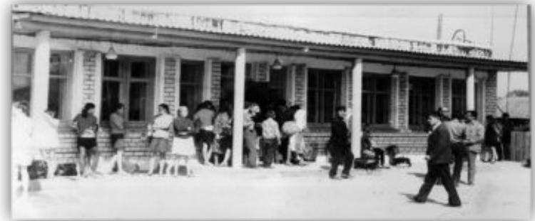
Моркинская автостанция. 1970-ые годы.