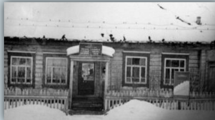
п. Морки. Контора связи. 1951 г.