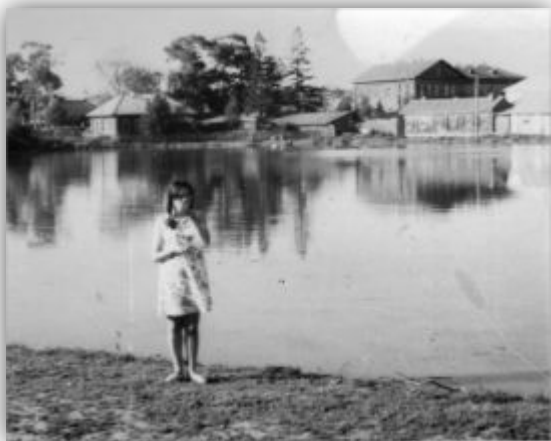
1970-ые годы.

Там, где сейчас находится этот Рыбаковский пруд, было болото. Впоследствии эти родники были забиты илом и перестали существовать.