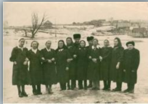
Коллектив работников Дома быта п. Морки . 1960-ые годы.