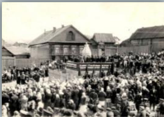
Митинг 9 мая 1945 г. в п.Морки