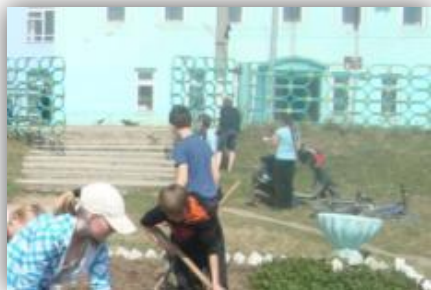
Вид на здание администрации муниципального образования "Городское поселение Морки» из Парка Победы. 2010 год.