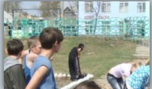
Вид на здание Дома быта из Парка Победы. 2010 год.