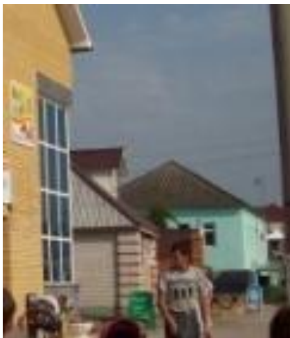
Второе белокаменное здание – дом купца Пичугина. 2009 год.