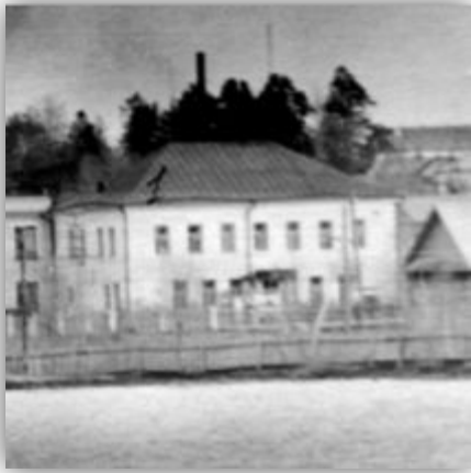
Здание поселкового совета поселка Морки . 1970-ые годы.