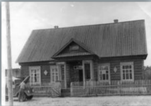
Здание мастерской. 1960-ые годы.

В первые годы советской власти на территории Моркинского района было организовано несколько бытовых промысловых артелей. Первая такая артель «Полыш» была создана для инвалидов. Это 1924 год. В 1926 году при артели «Полыш» открывается пошивочный цех.