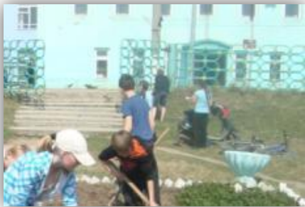
Вид на здание администрации муниципального образования "Городское поселение Морки» из Парка Победы. 2010 год.