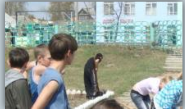
Вид на здание Дома быта из Парка Победы. 2010 год.