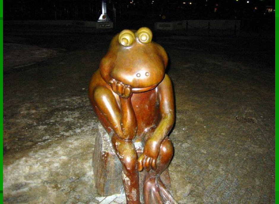
Памятник лягушке в Бостоне