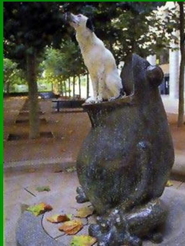
Памятник лягушке возле здания Института Пастера в Париже.