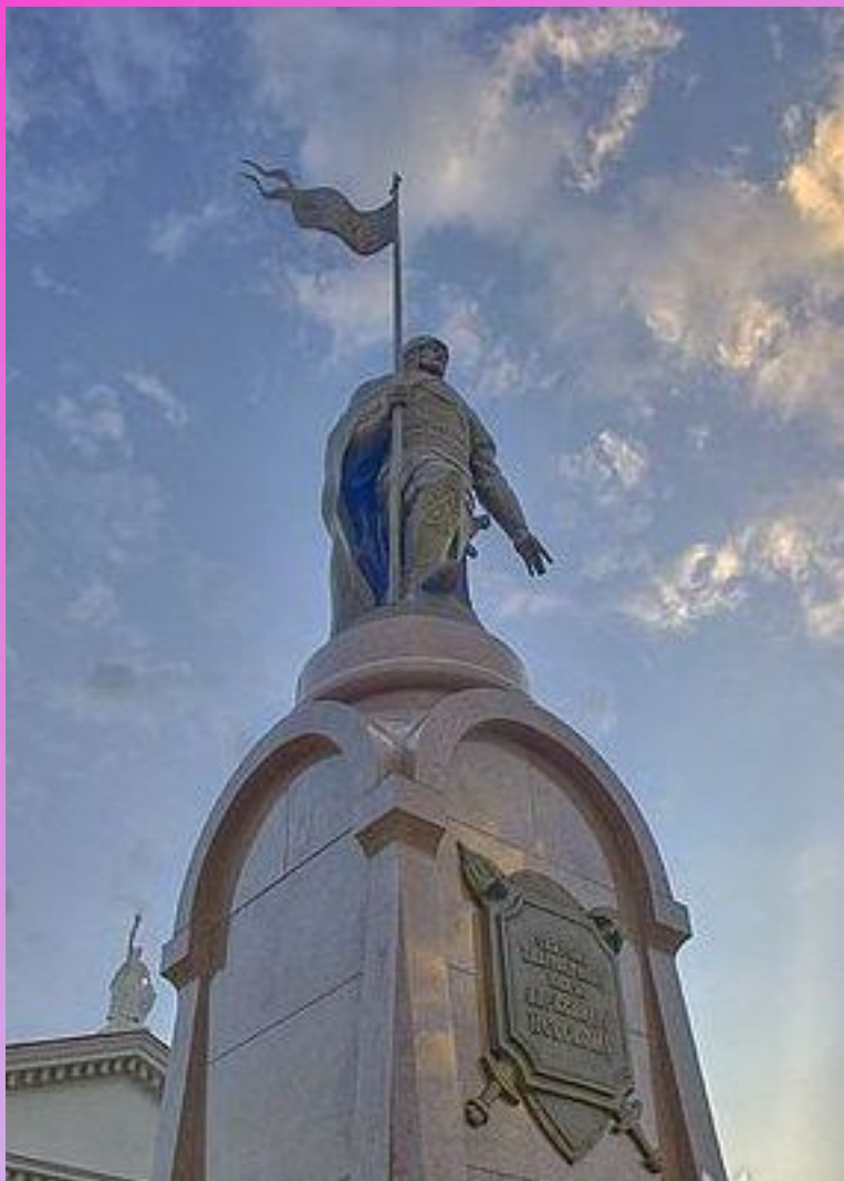
Рядом с театром памятник Александру Невскому