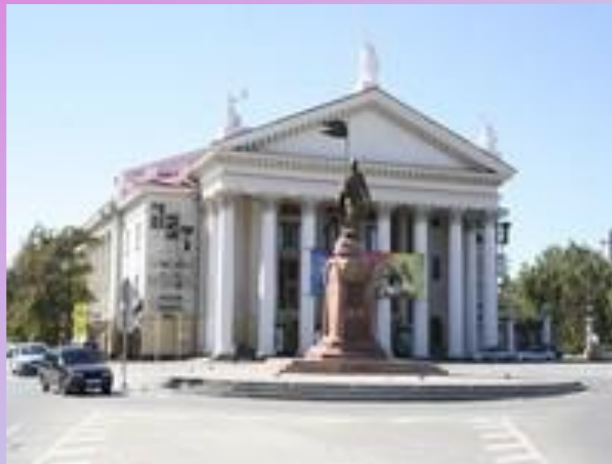
Здание театра стоит на центральной площади города