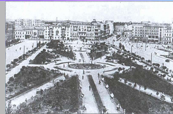
Центр Сталинграда перед войной