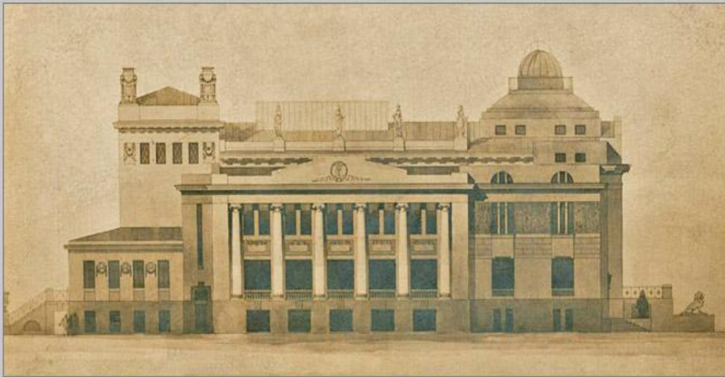
Домь "Науки и Искусствъ"

Здание театра НЭТ на площади Павших борцов, несмотря на кажущуюся Сталинскую монументальность, тоже относится к зданиям Царицынской застройки. В Царицыне это был Дом