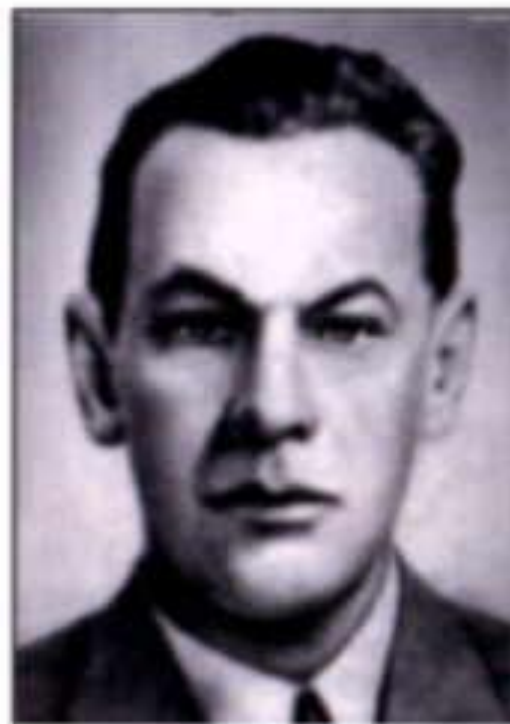
Р. Зорге в молодые годы.