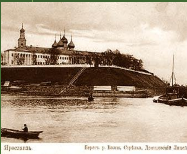
Ярославль. Берегъ р. Волги, Сербска, Демидовскій Лицей.