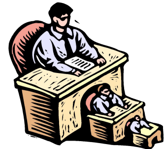
Старая структура власти