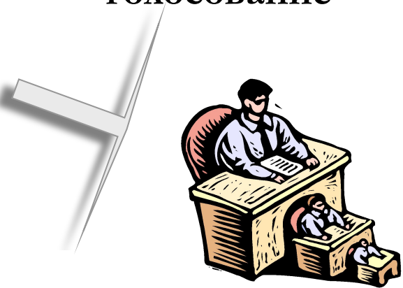
Старая структура власти