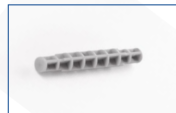
Держатель рулона чековой ленты