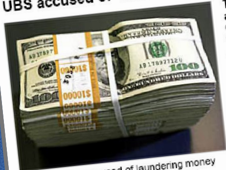
UBS stands accused of laundering money in violation of the US embargo against Cuba

Three members of the United States House of Representatives accused Switzerland's largest bank, UBS, of laundering Cuban government money. They are calling for an investigation into transactions worth $4.9 billion alleged to have been made between 1997 and 2004.