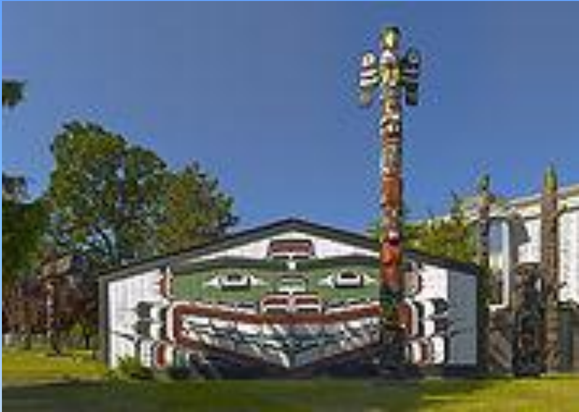
Тотем Кваквака'вакв и традиционный большой дом в Виктории, Британская Колумбия