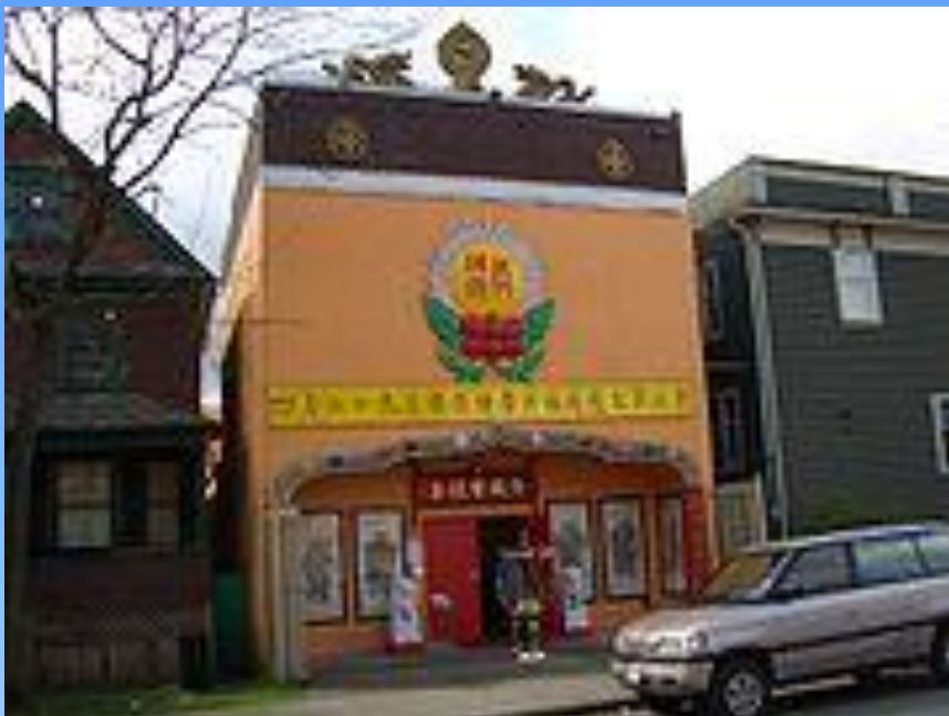
Буддистский храм в Ванкувере