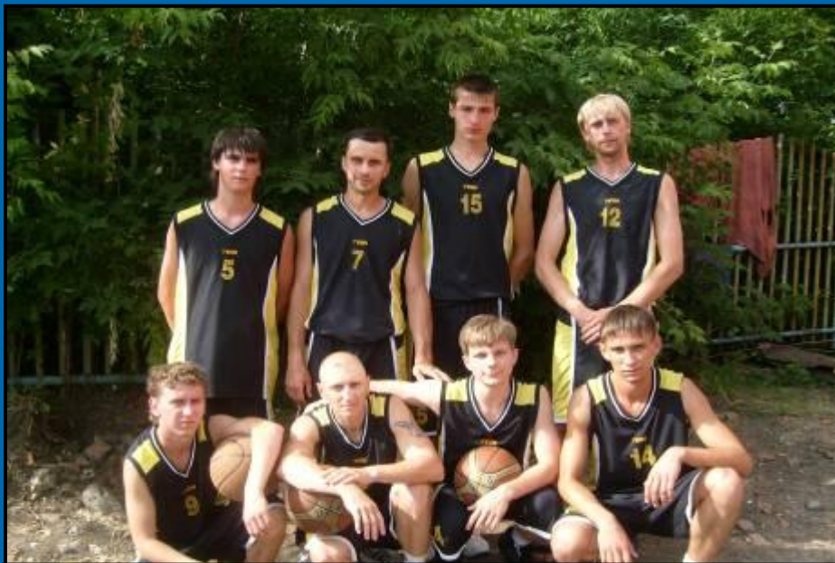
Баскетбол. Мужская команда