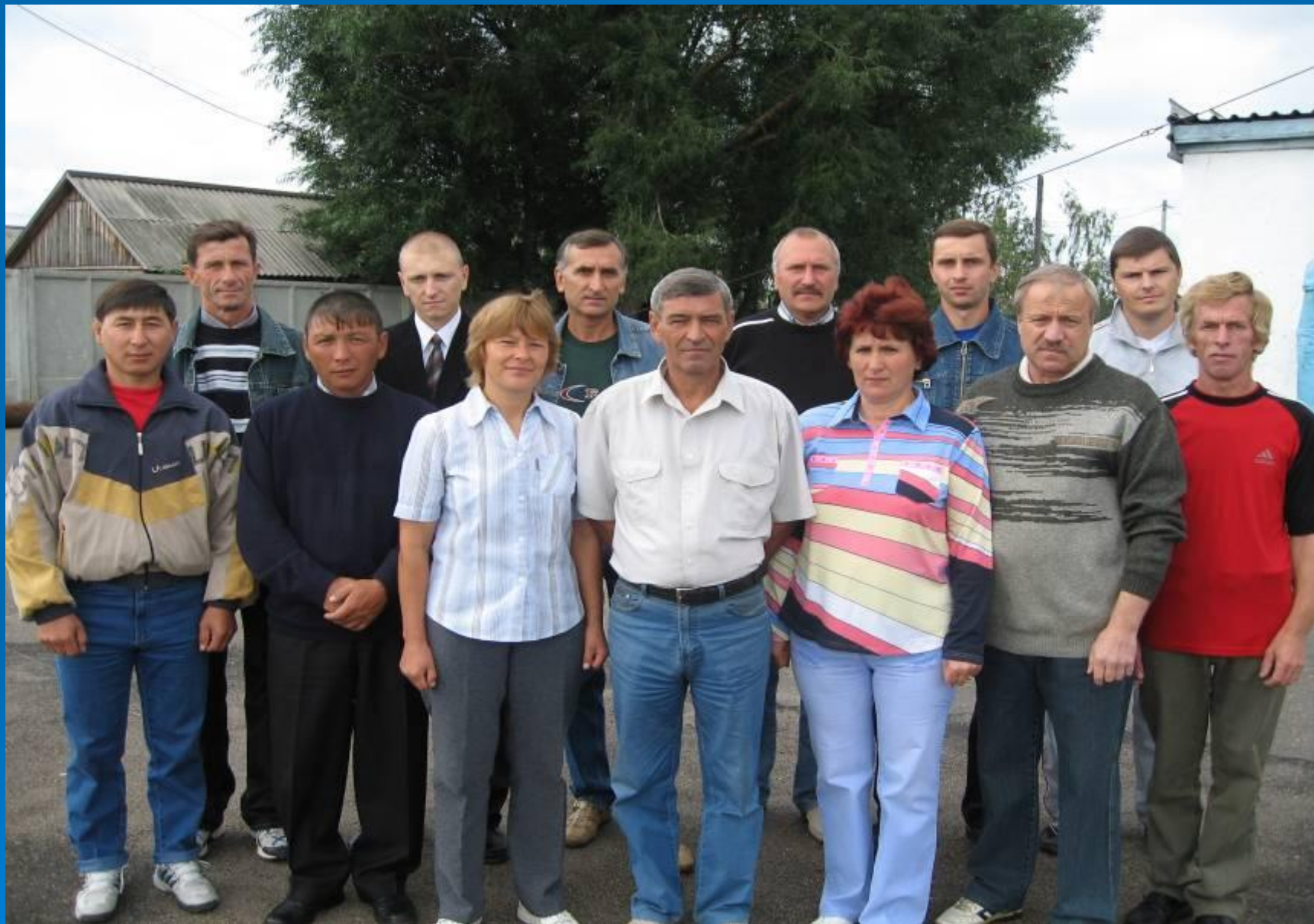
Коллектив ДЮКФП Русскополянского района – 2007 год.