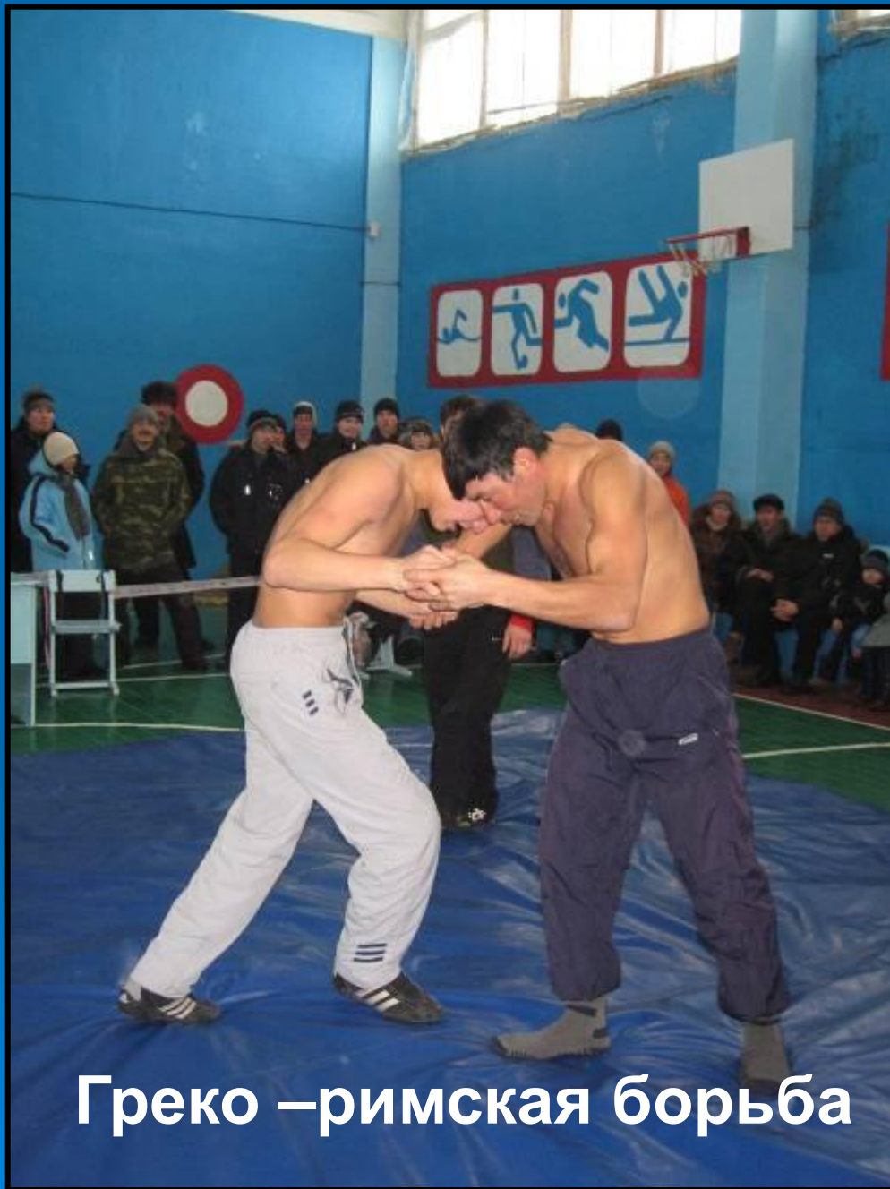
Греко – римская борьба