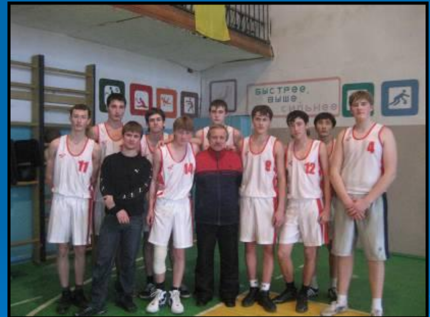
Баскетбол Юношеская команда