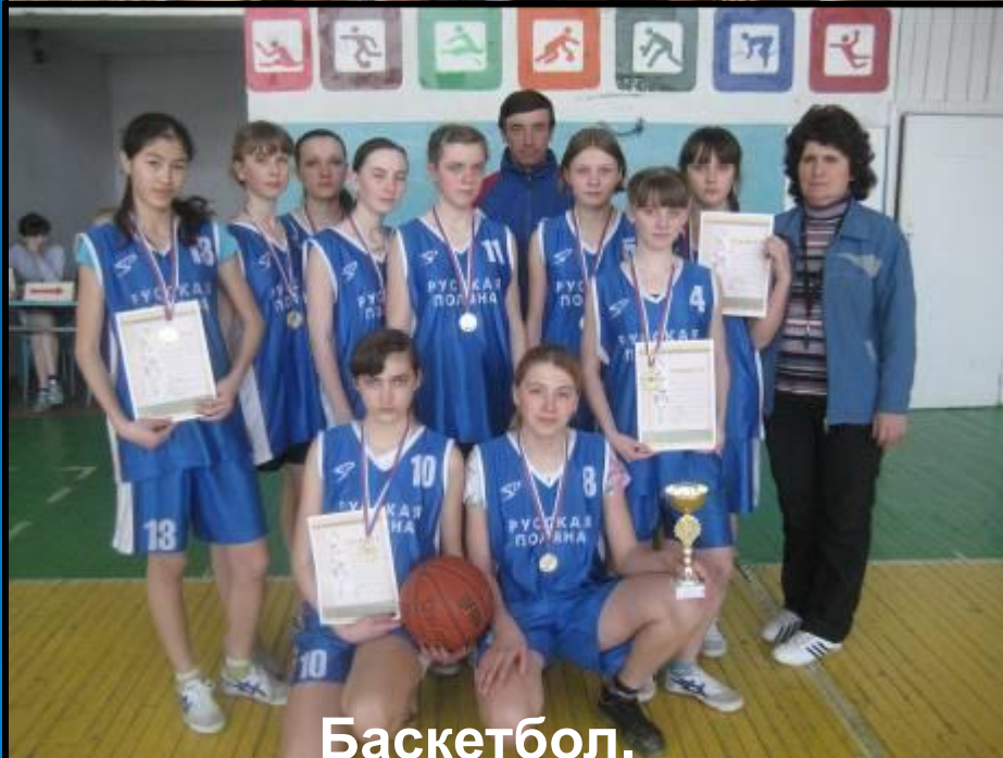
Баскетбол. Женская команда