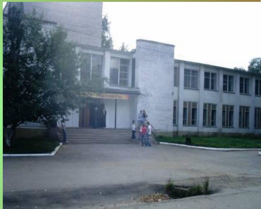
Районный Дом культуры