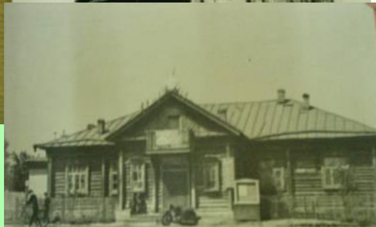
СК Большой Гондырь