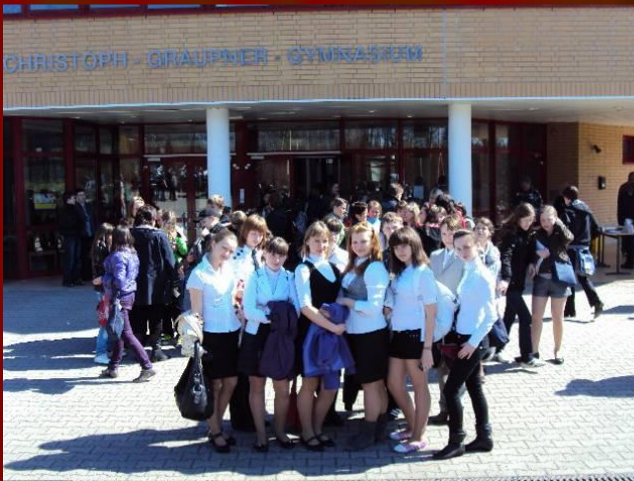
Место проведения олимпиады