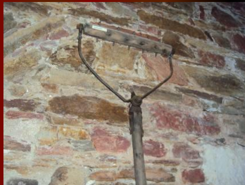
Камера пыток №3