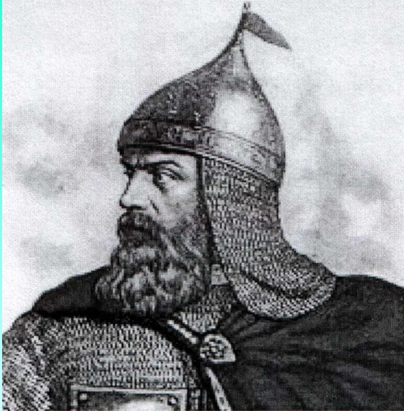
Портрет Дмитрия Донского в боевом облачении