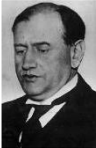
Премьер-министр Франции Деладье