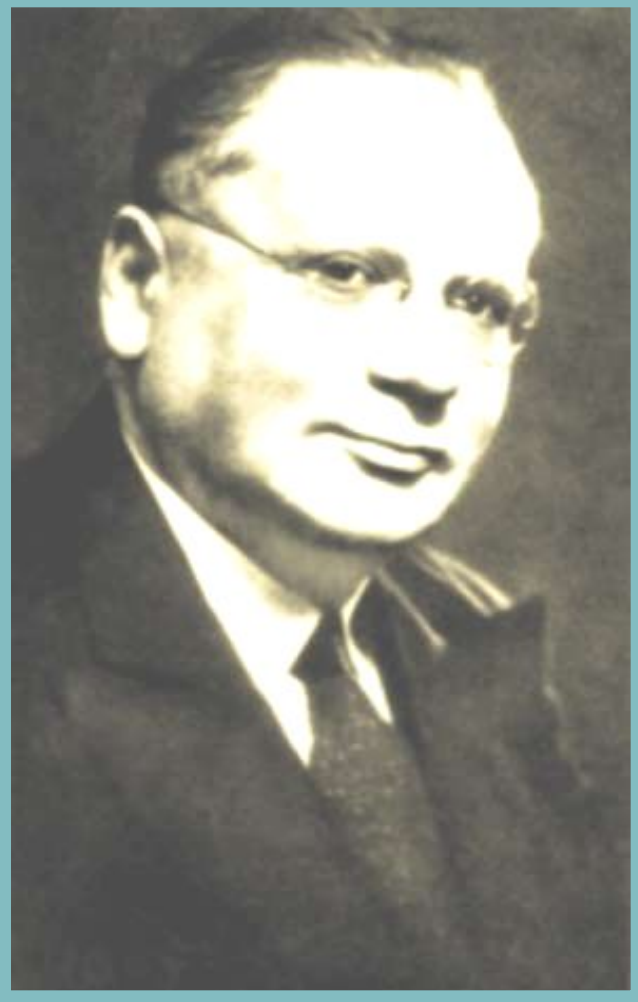
Нарком иностранных дел М.М. Литвинов

«Новый курс» советской дипломатии во многом был связан с деятельностью нового наркома иностраннных дел М.М. Литвинова (1930-1939) 1939, май наркомом становится В.М. Молотов