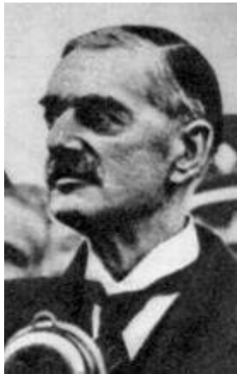
Премьер-министр Англии Чемберлен

После Мюнхенской конференции Англия и Франция провозгласили наступление «эры мира». В марте 1939 г. Гитлер ввел войска в Прагу и лишил Чехословакию независимости, а затем захватил Мемельскую область принадлежавшую Литве. В апреле Италия захватила Албанию и Англия и Франция пошли на переговоры с СССР. 12 августа иностранные делегации прибыли в Москву. Но они не обладали никакими полномочиями. Советская сторона представила план совместных действий.