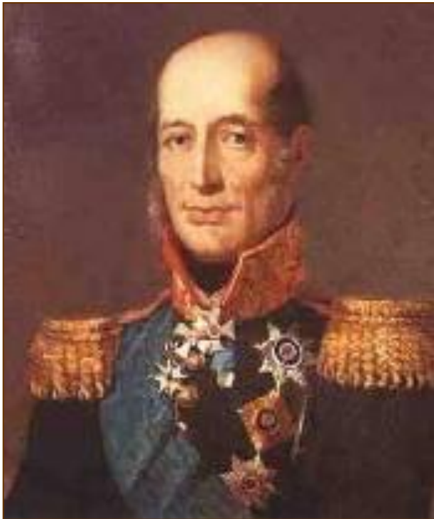
М.Б. Барклай де Толли

...душой готов на подвиг ратный, Берег войска, не шел вперед, А шел упрямо на попятный. И невзлюбил его народ. И недовольства смутный ропот Шел словно тень за ним шаг в шаг. Сквозь канонаду, конский топот Он слышал вечное: чужак... Упряма заблуждений сила. И даже Пушкина перо Не очень-то и защитило, Добром воздавши за добро.