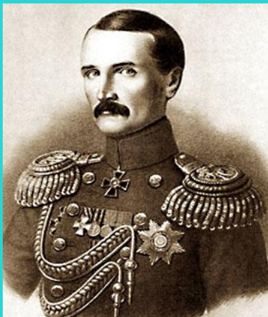
Корнилов Владимир Алексеевич (13 февраля 1806 года — 17(5) октября 1854 года).