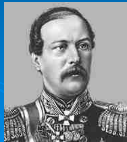
Тотлебен Эдуард Иванович (8(20).5.1818, — 19.6(1.7).1884).