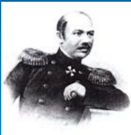
Истомин Владимир Иванович (6(18).03.1809 г. — 7(19).03.1855 г.).