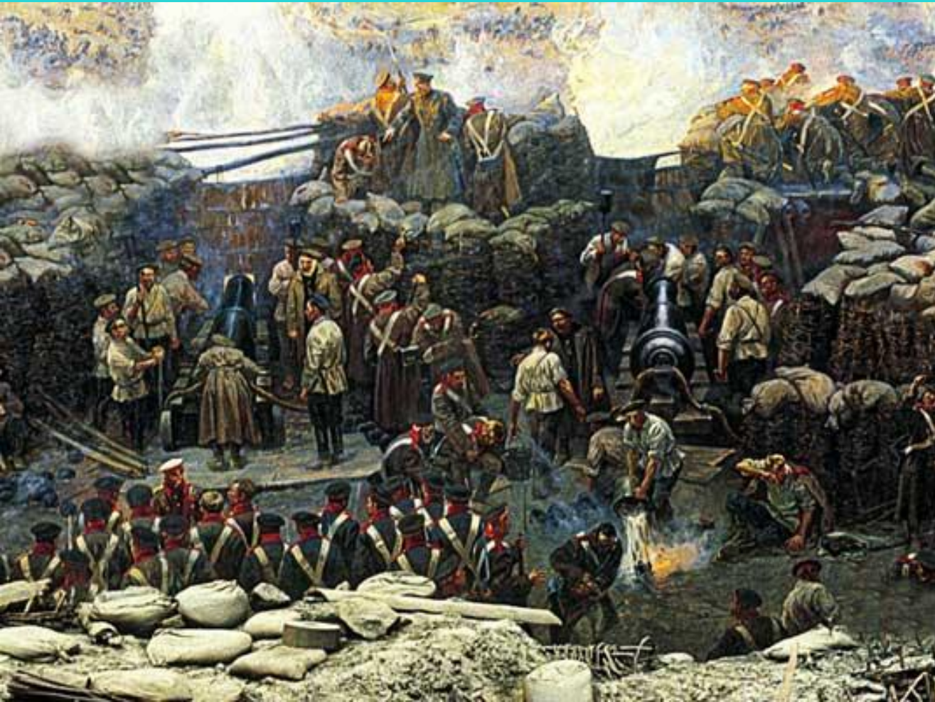
Ф.Рубо. Оборона Севастополя