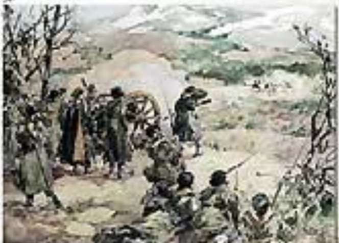
А. АПОД, ВООРУЖЕННЫЕ И ЗАЩИТА ЧУЖДАЯ ЗЕМЛЯ. 1912