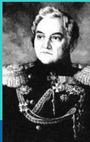
Лазарев Михаил Петрович (3 (14).11.1788. — 11 (23).04.1851).