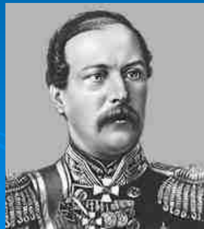
Тотлебен Эдуард Иванович (8(20).5.1818, — 19.6(1.7).1884).