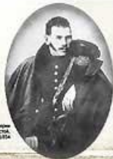
Портрет артиллерийского генерала Толстого, Дачное, 1874