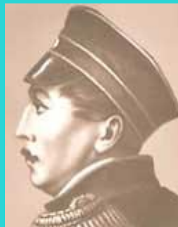
Павел Степанович Нахимов