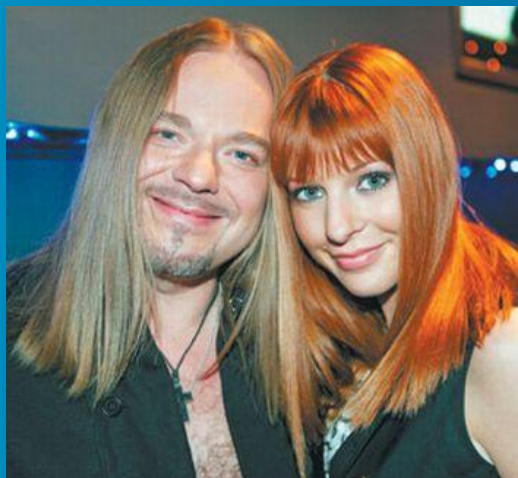
Владимир Пресняков и Наталья Подольская