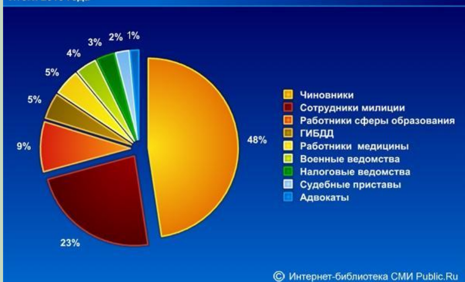
Профессиональная коррумпированность по материалам российских СМИ, % Итоги 2010 года

Наибольшая доля от общего количества фактов взяточничества и злоупотреблений приходится на чиновников – 48%