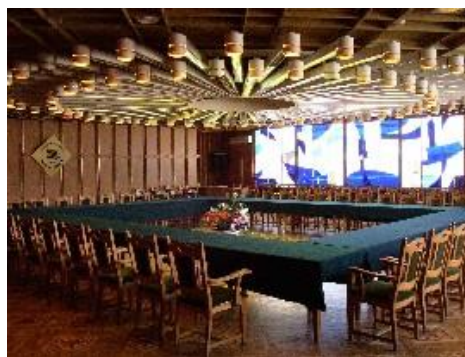
Зал «Под люстрой» (120 человек) 2500 руб. в час