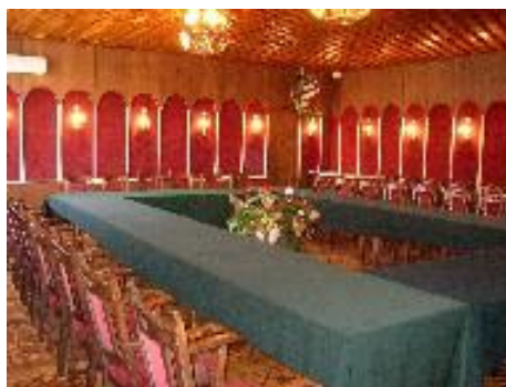
Зал «Бордовый» (40 человек) 2000 руб. в час