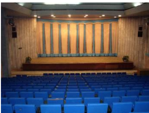
Киноконцертный зал (450 человек) 3500 руб. в час