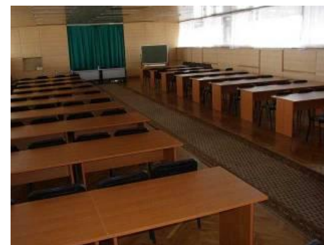
Зал «Панорама» (100 человек) 2500 руб. в час