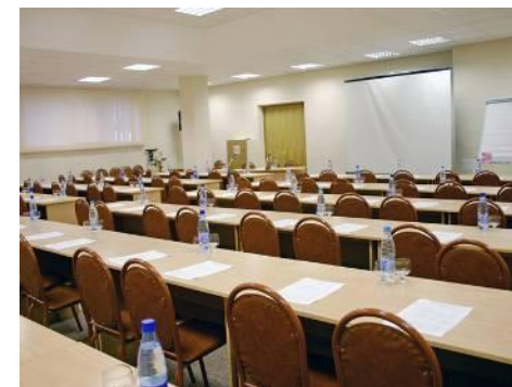
Зал «Янтарный» (100 человек) 2500 руб. в час