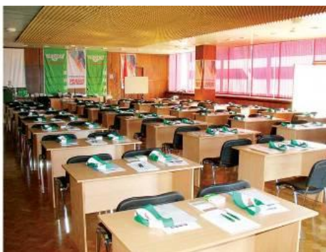
Зал «Ореховый» (100 человек) 2500 руб. в час