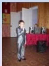
Конкурс лучших чтецов по литературному чтению.