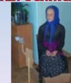
Конкурс «В гостях у сказки».