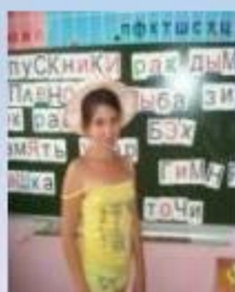
Предметные олимпиады, викторины по русскому языку, математике.