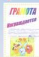
Исследовательская работа «Мои предки. Генеалогическое древо моей семьи».