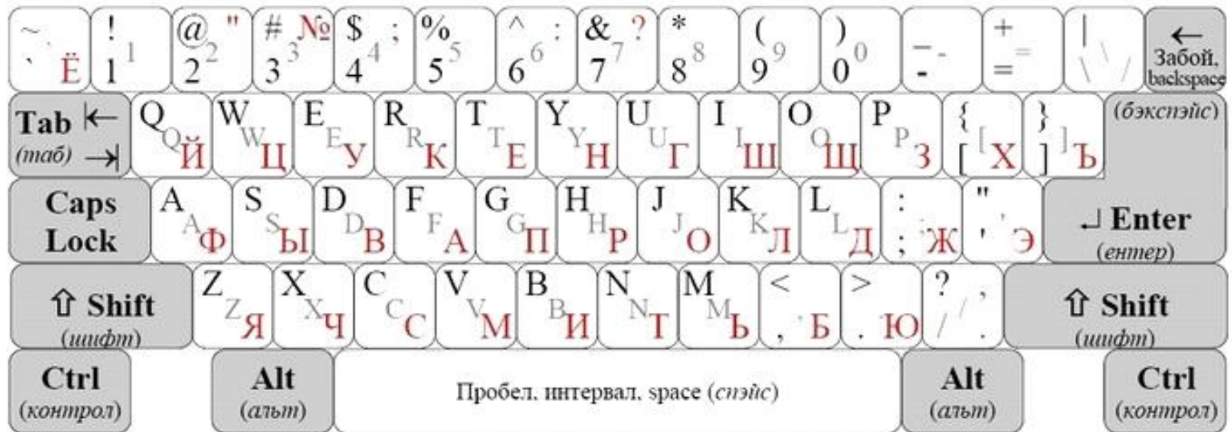
Рис. 1. Образец алфавитно-цифровой клавиатуры

Место ввода очередного символа на экране монитора отмечается мигающей черточкой – курсором .