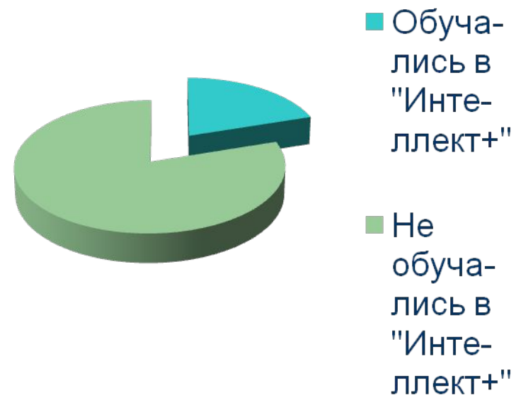
Доля обучающихся в «Интеллект+»