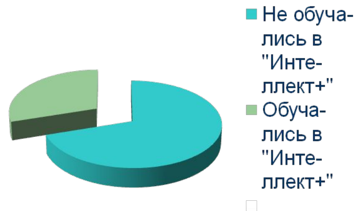
Доля обучающихся в "Интеллект+"