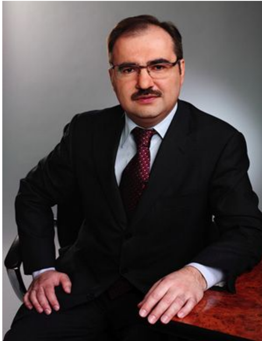
Антон Викторович Дроздов Председатель Правления Пенсионного фонда Российской Федерации