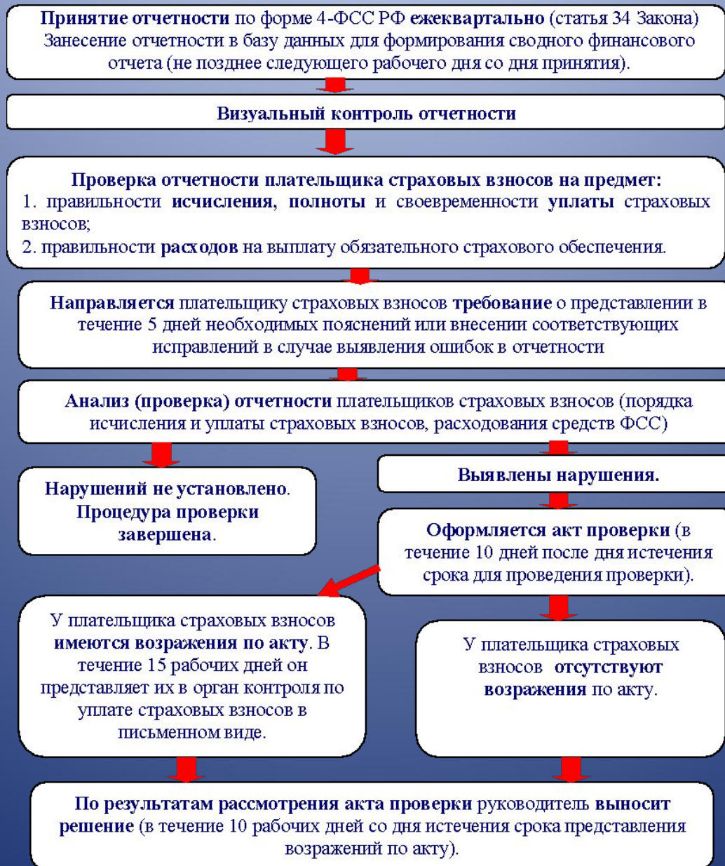
Таблица № 7