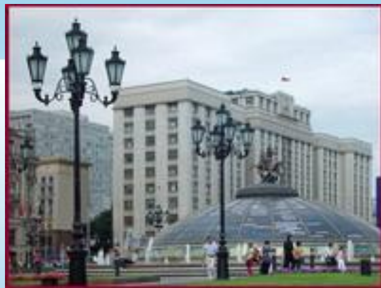
Государственная Дума ФС РФ

замечания и предложения к законопроекту направлены в Государственную Думу Федерального Собрания РФ