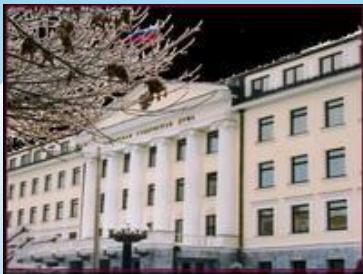
Самарская Губернская Дума