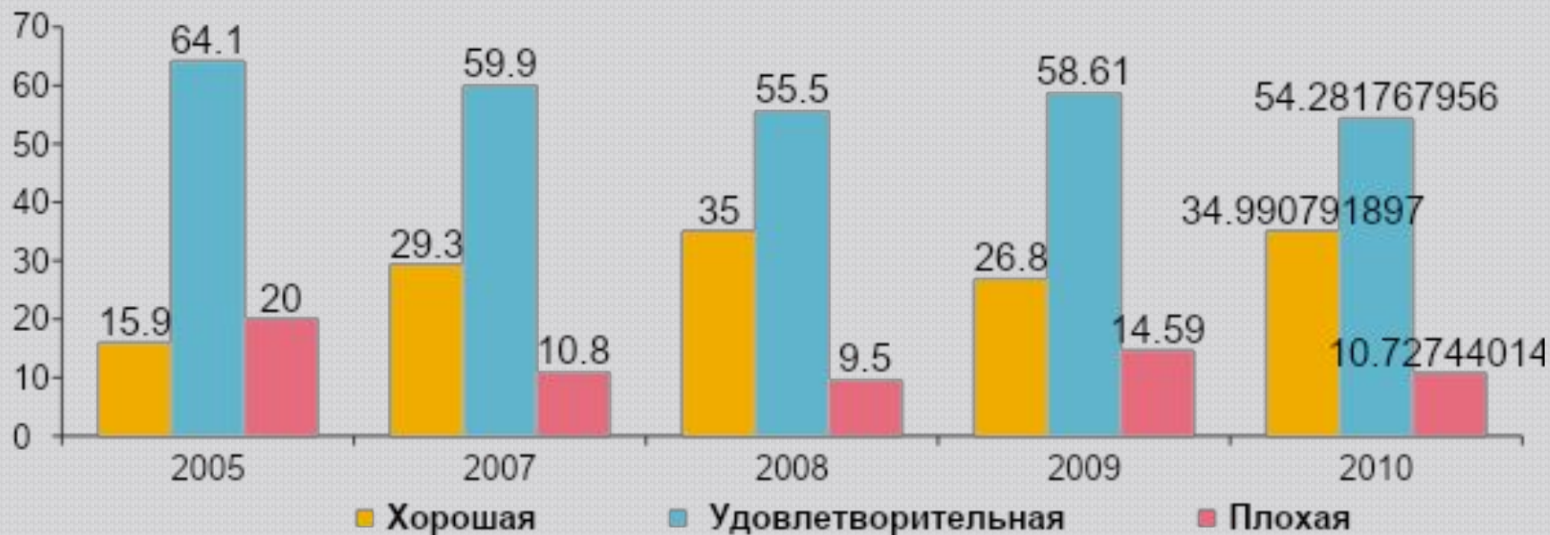
Динамика оценки населения экономической ситуации

В оценках населения экономическая ситуация после некоторого ухудшения в 2009 году постепенно выравнивается, а удовлетворенность населения экономической ситуацией в регионе достигла показателей 2008 года