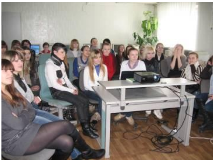
Группа № 031 на занятиях П/О

За время своего существования ПТК УО РИПО подготовил не одну группу операторов ЭВМ и страховых агентов. Многие из них сейчас работают по своей специальности, многие продолжают учебу в различных средне - специальных и высших учебных заведениях.