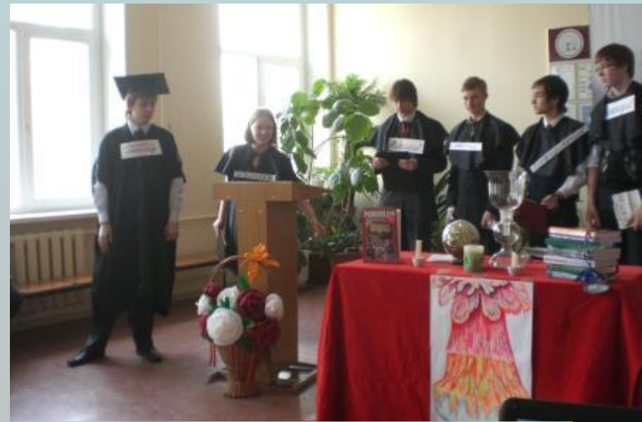
Заседание «Ученого совета»