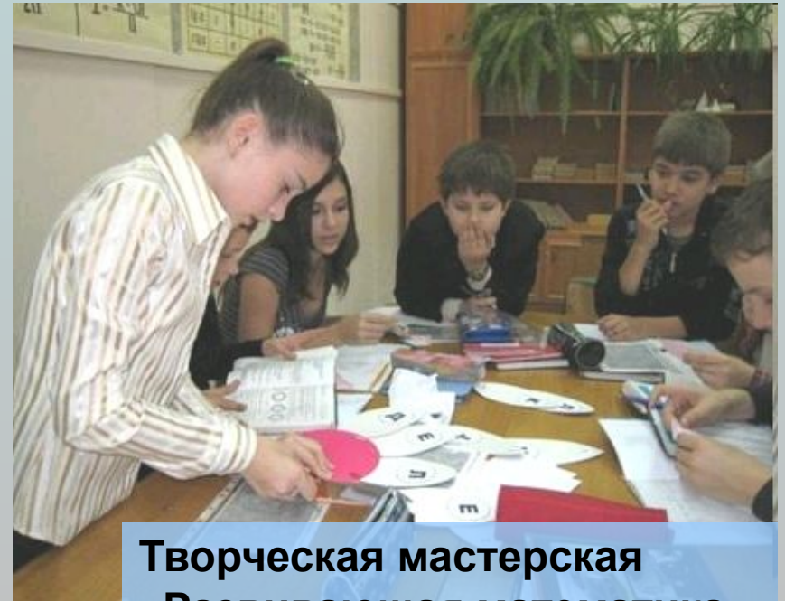
Творческая мастерская «Развивающая математика»