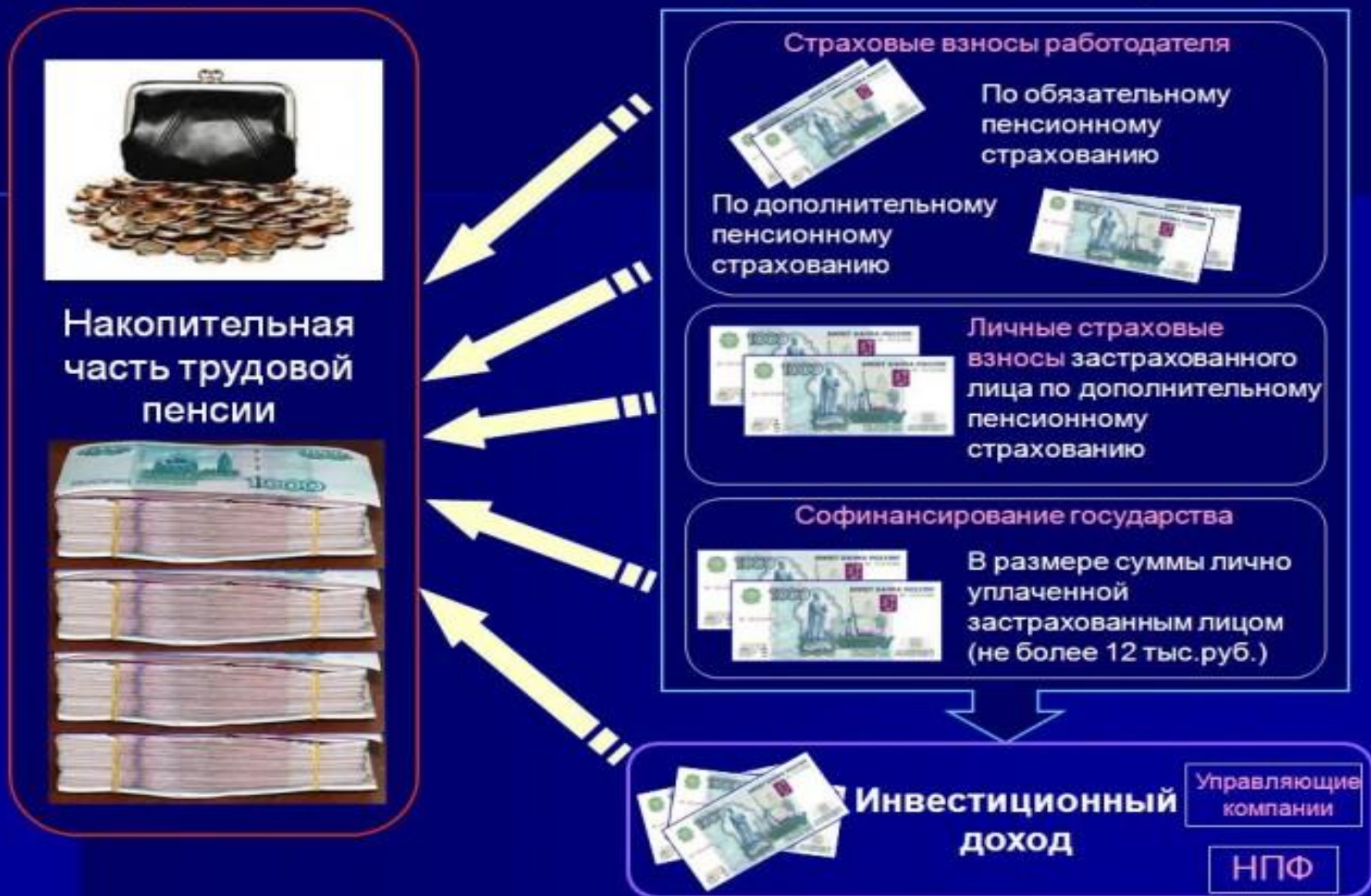
Схема формирования накопительной части трудовой пенсии после принятия 56-ФЗ