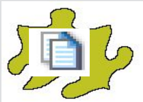
Акт выполненных работ