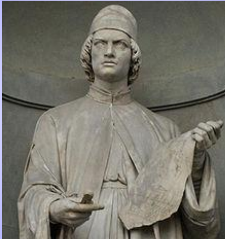
Статуя Альберто в Уффици