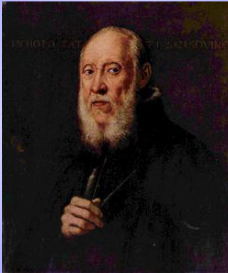
Сансовино, портрет Тиноторетто