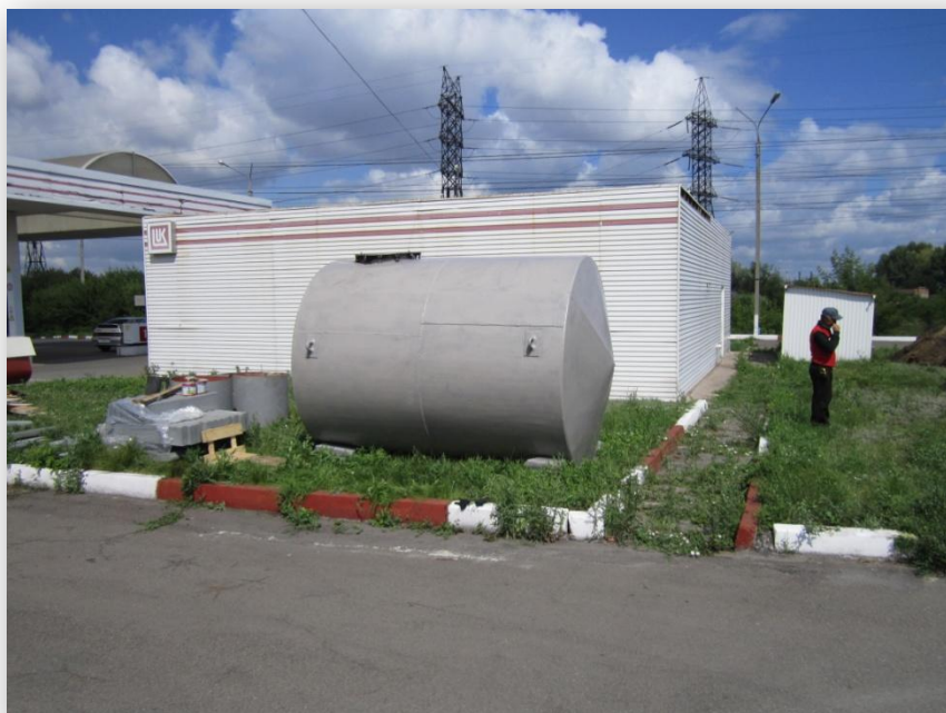
АЗС «ЛУКОЙЛ», г.Магнитогорск