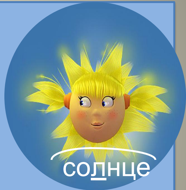
со л н ц е