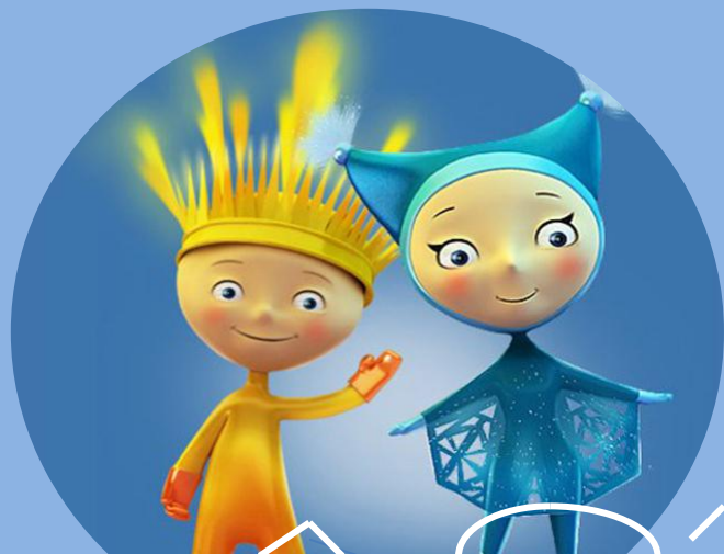
луч и к