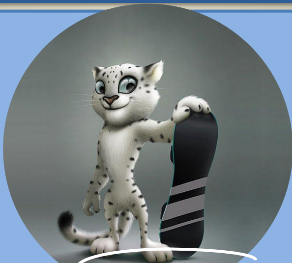
ле о па р д