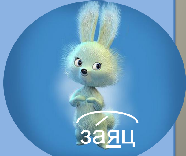
за я ц