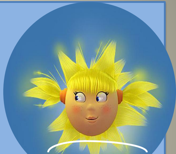
сол н це