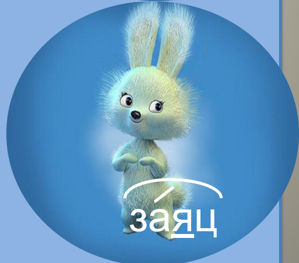
за я ц