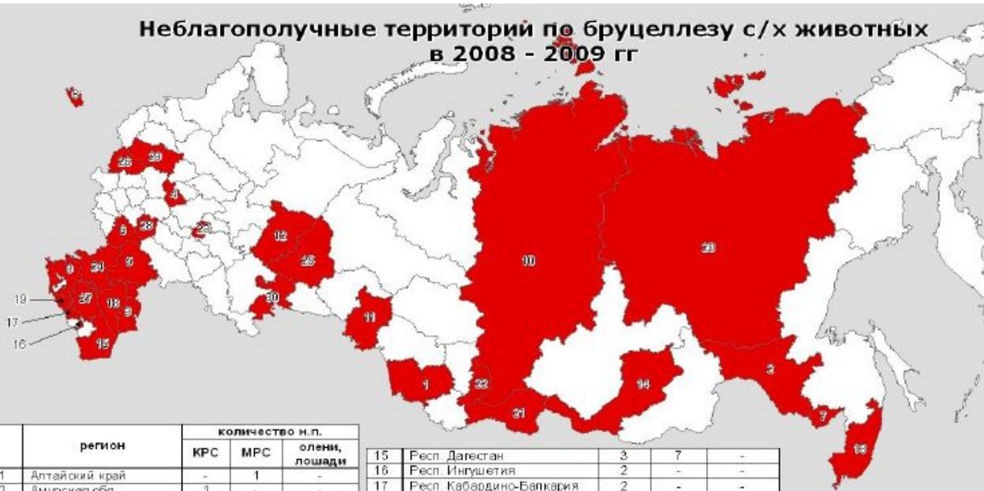
Неблагополучные территории по бруцеллезу с/х животных в 2008 - 2009 гг

Бруцеллез – хроническая инфекционная болезнь, вызывающая поражение многих систем жизнеобеспечения. На территории России бруцеллез крупного рогатого скота особенно широко распространен на Северном Кавказе и Нижнем Поволжье. В 2008 году заболело бруцеллезом 7 435 голов КРС, 1 791 голов МРС, сдано на убой 7 329 голов КРС, 1 783 голов МРС. В 2009 году риск распространения заболевания «значительный».