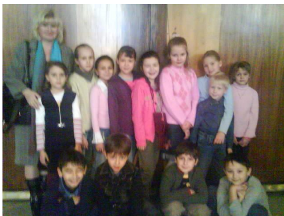
Театр «Сатирикон» спектакль «Ай, да Пушкин!»