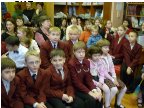
День Матери в районной библиотеке