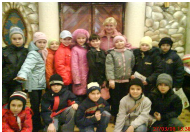
Мы в «Союзмультфильме»