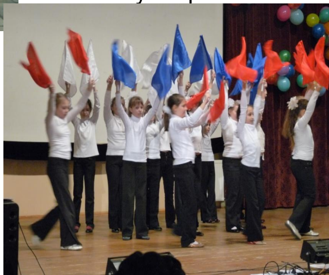
Наши девочки выступают на сцене акт. зала нашей школы на Дне гимназиста