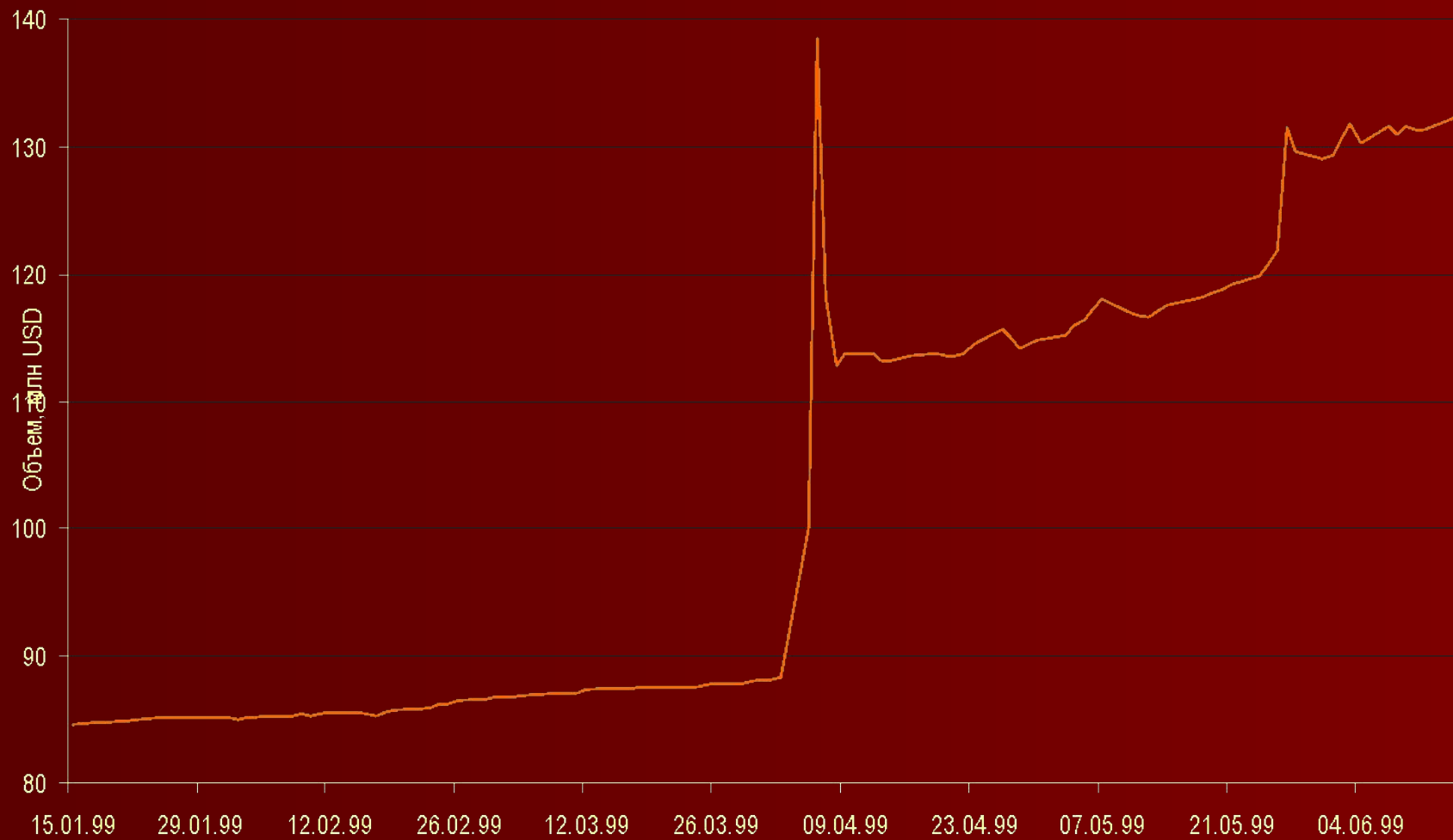
Курс доллара США к тенге