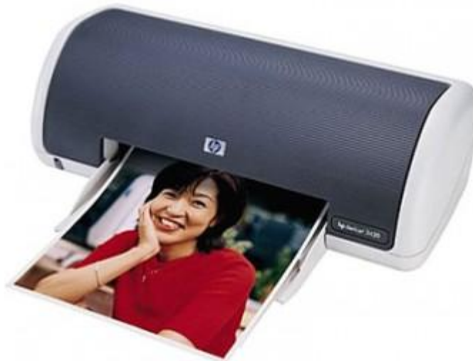
HP струйный DeskJet 3420 USB