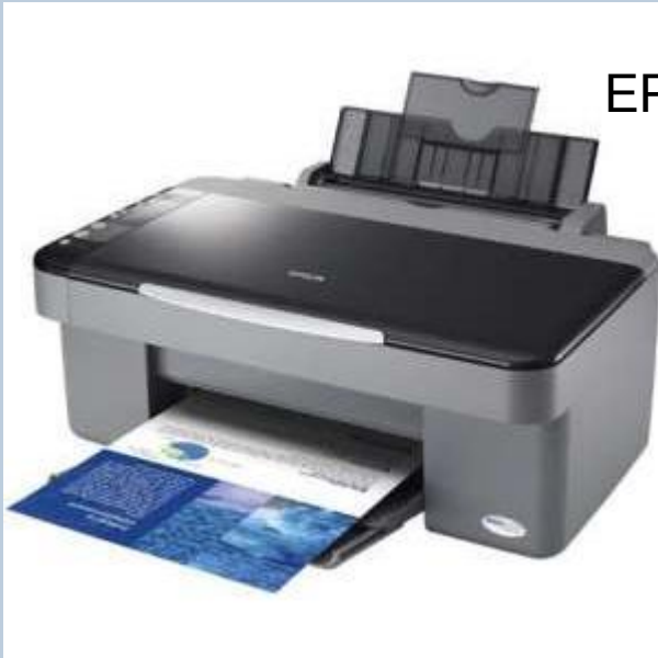
EPSON STYLUS CX