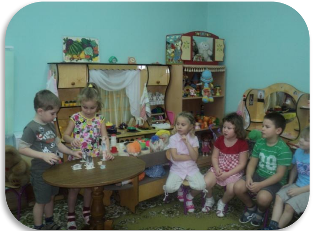
Рассказываем сказку «Усатый полосатый»