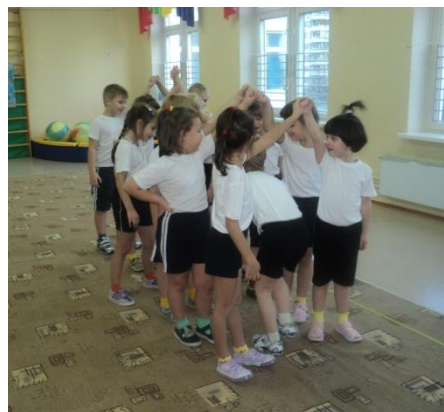
Наш любимый «Ручеек»!