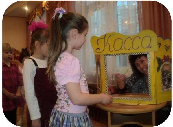
Получить билет для путешествия