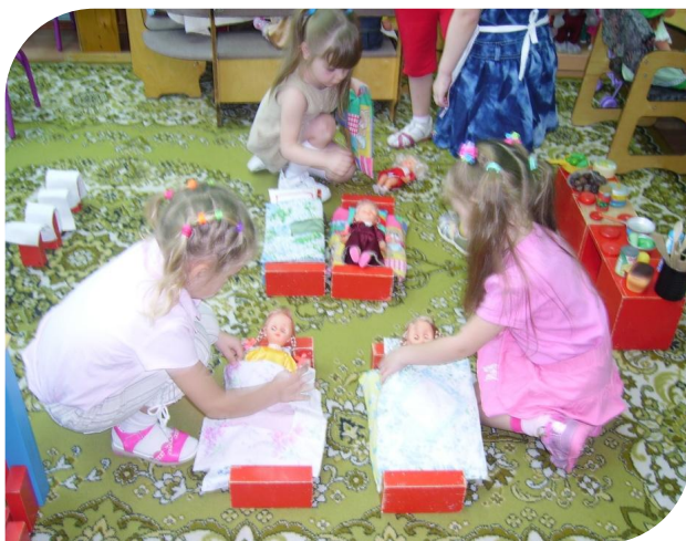
Играли в детский сад