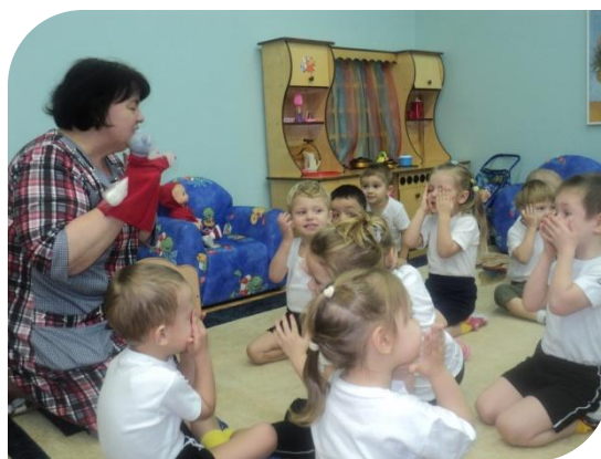
Научим котика умываться