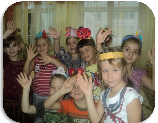
Мы разыграли сказку «Стрекоза и муравей»