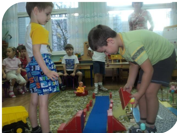
И строили мосты для путешествий