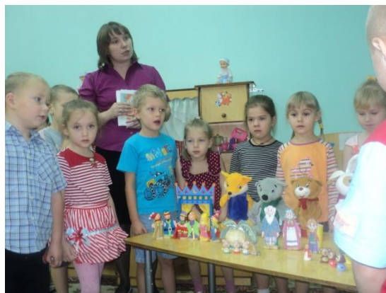
В сказочном царстве