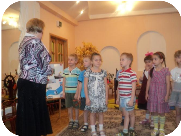
У памятника Петру 1