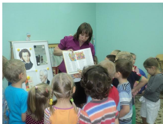
Знаешь ли ты поэтов