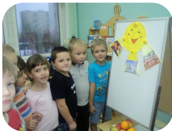
Где прячется здоровье?