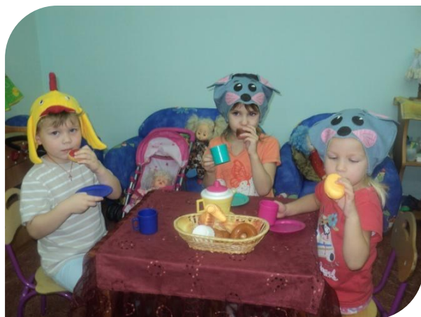
Как хороша игра в театр!