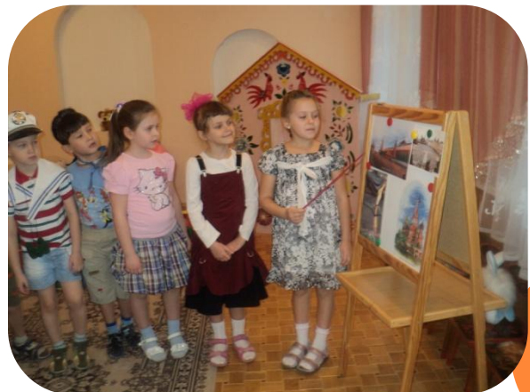
И побывали на Красной площади