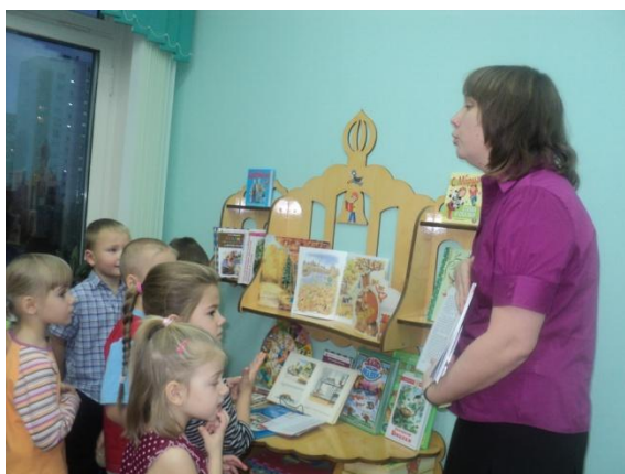
В мире литературы