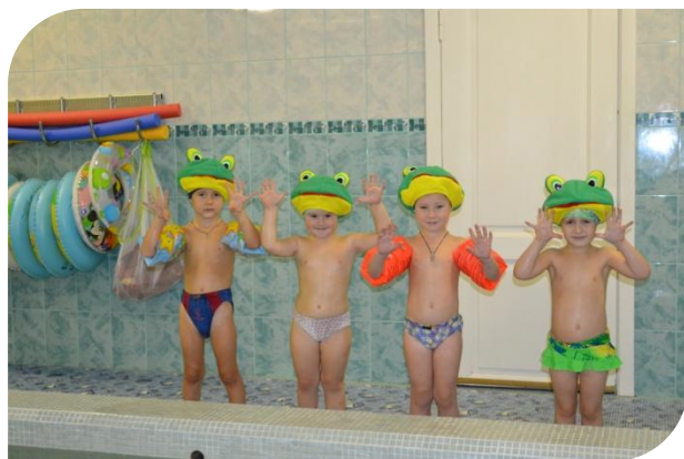
Лягушата на болоте!