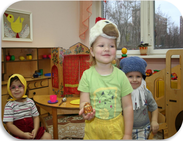
Играем в «Репку»