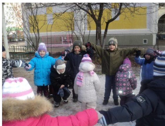
«Кот и мыши»