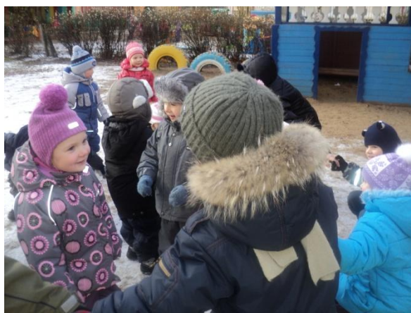
...И водили хоровод...