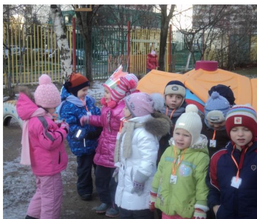
Хитрая лиса, где ты?..