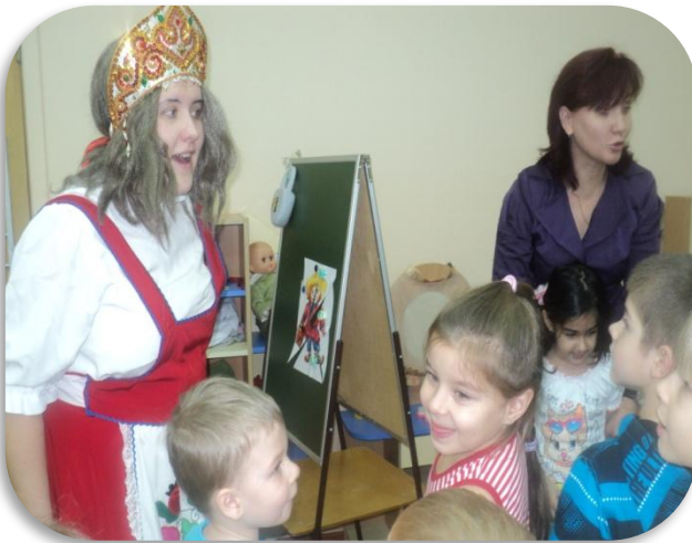
В гости к домовенку Кузе