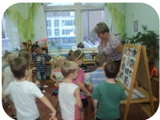
Мойдодыр в гостях у детей