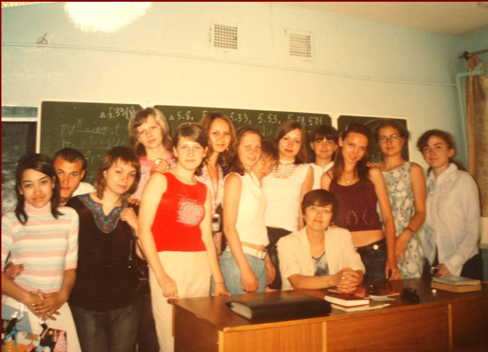
Группа 04-ООС (1 курс)