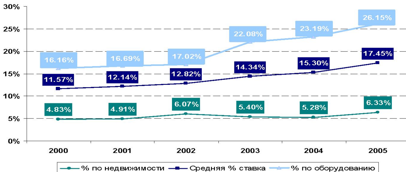
Удельный вес лизинга в инвестициях