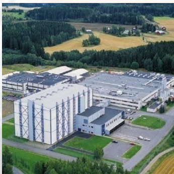
Завод в г. Раяяки