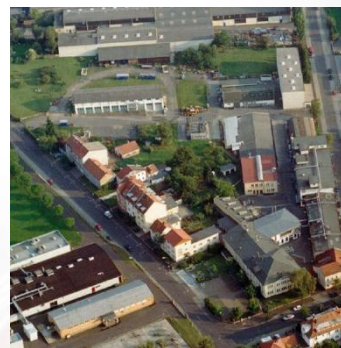
Завод в г. Фульда