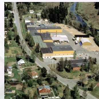
Завод г. Транему