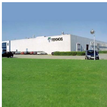
Завод в г. Вамдруп