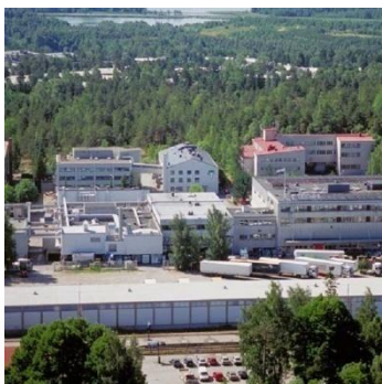
Завод в г. Хельсинки Головной офис концерна