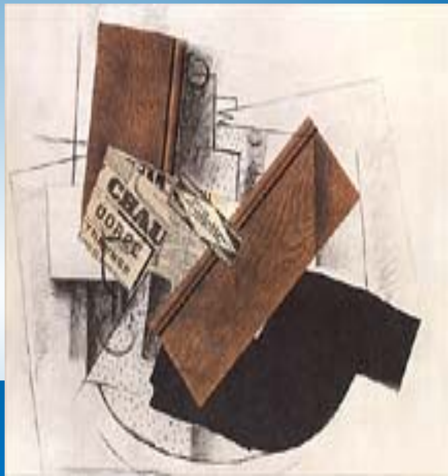
«Натюрморт на столе»