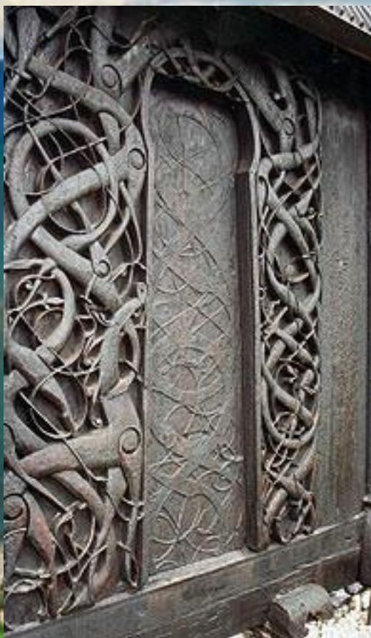
Фрагмент интерьера деревянной церкви Урнес, Норвегия