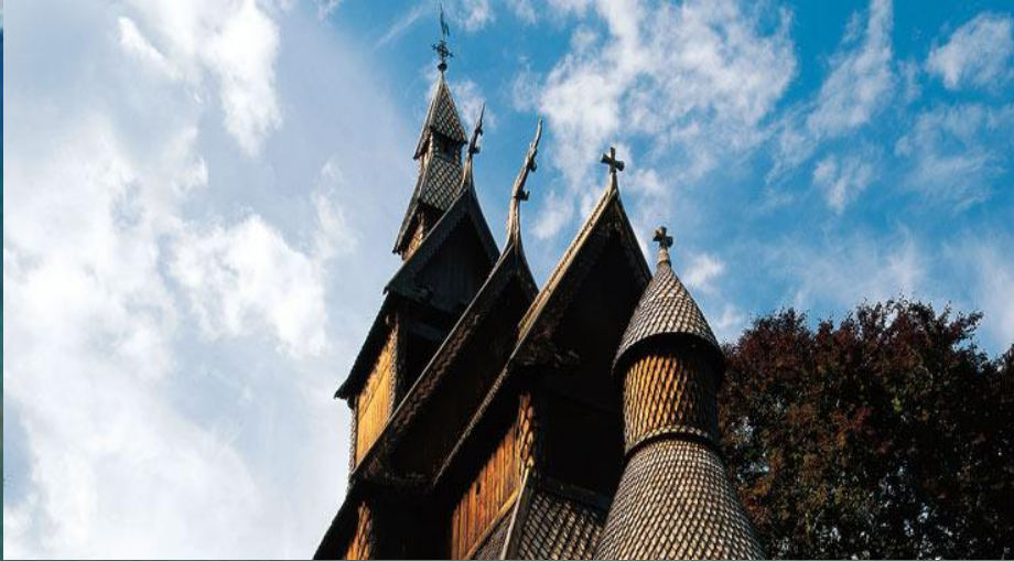
Деревянная церковь Хопперстад в Вике, Норвегия