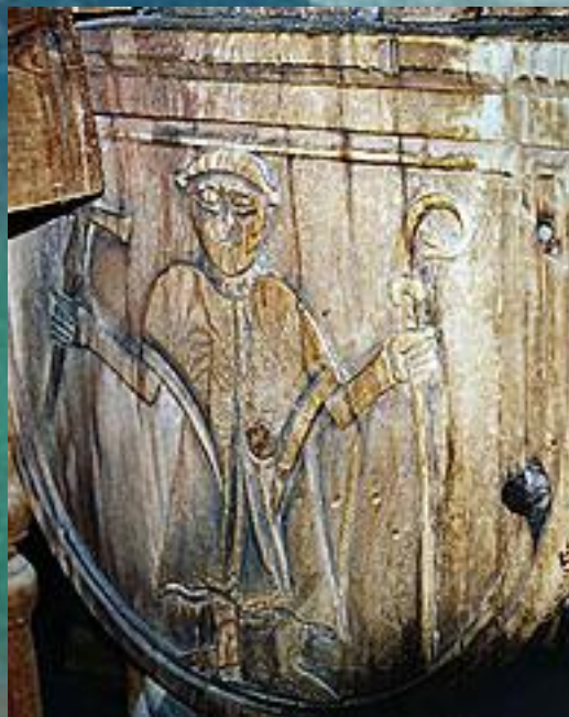
Изображение епископа или паломника на одном из столбов в деревянной церкви Урнес, Норвегия