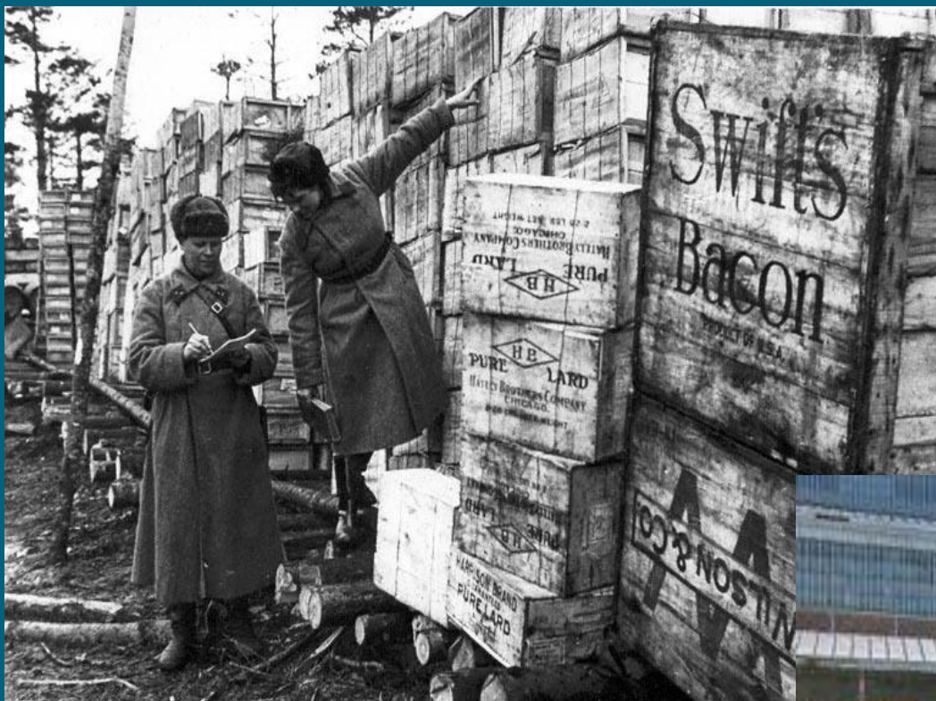
Американское продовольствие на одном из складов

Танк М3 «Ли» танкисты прозвали «братская могила на шестерых»