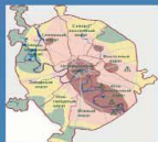
Карта здоровья города