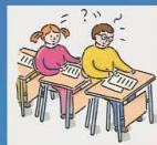
Построение траектории урока