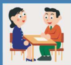
Основная образовательная программа школы