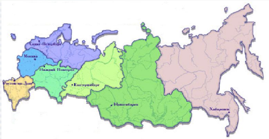
Рис. №1 Численность населения РФ