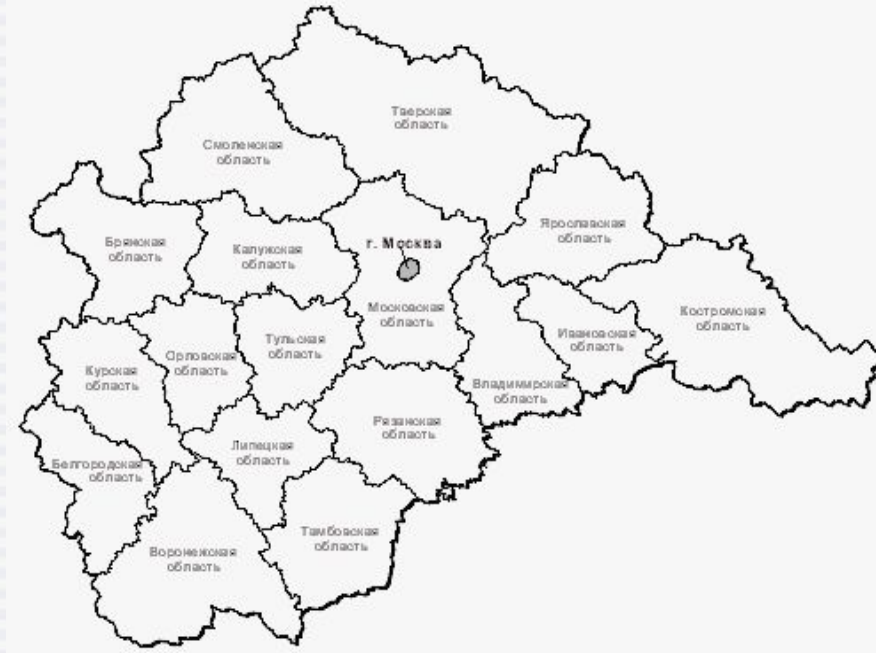
Рис. №13 Численность населения ЦФО