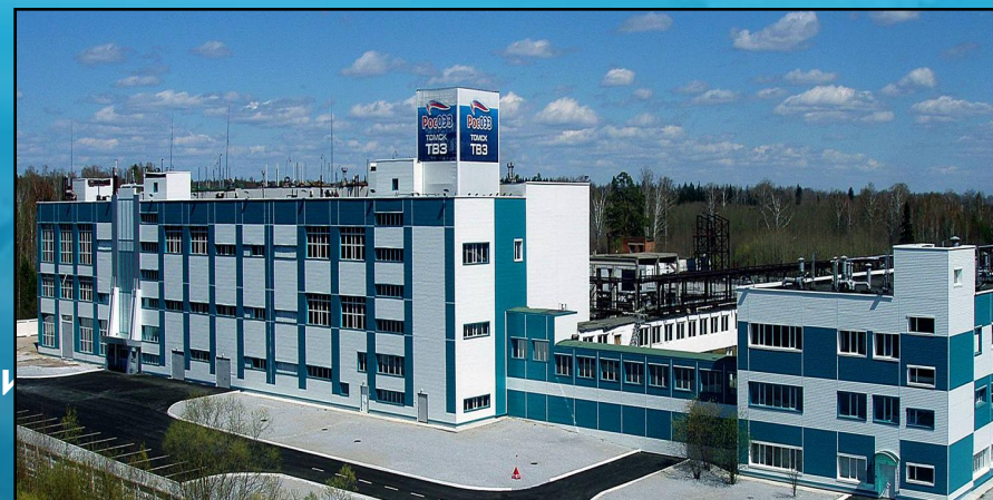
Здание резидента ОЭЗ - ООО «НИОСТ» (Северная площадка)