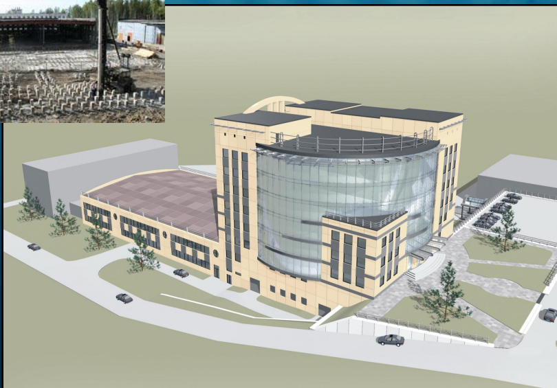
Центр инноваций и технологий (площадка «Южная»)