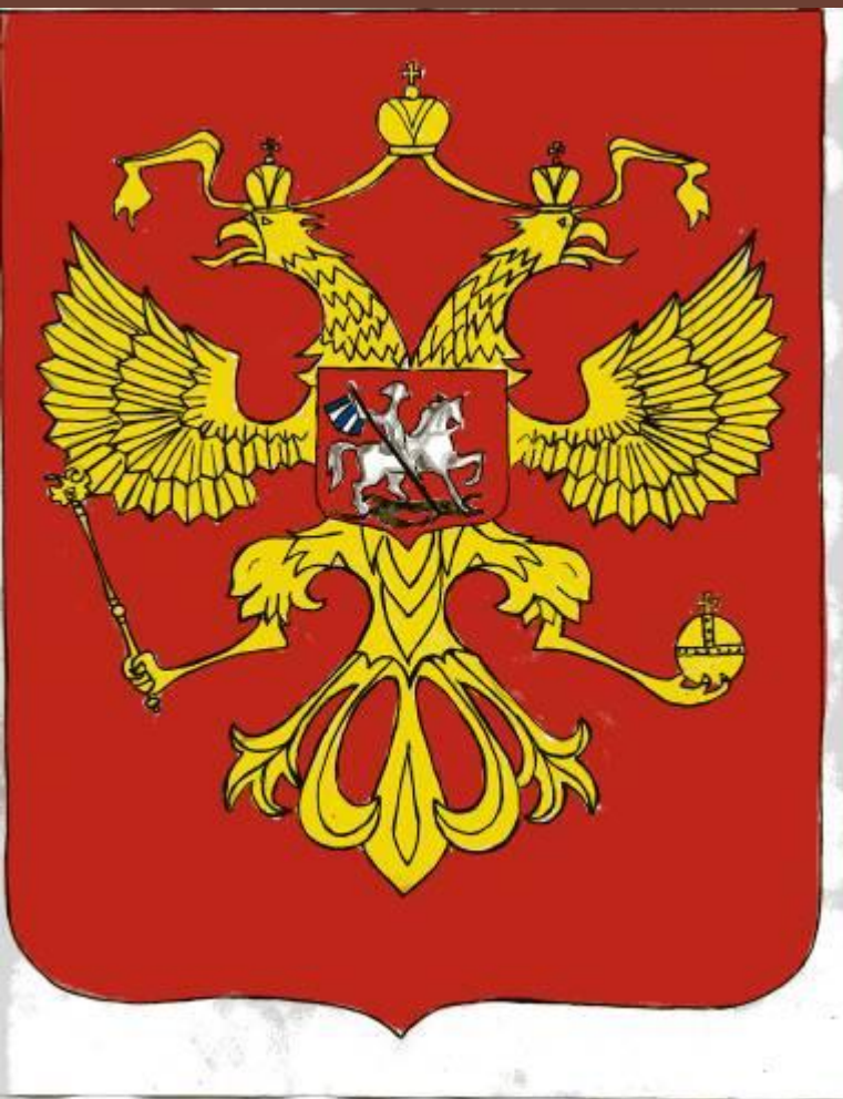
Герб Российской Федерации (рисунок учащихся)

Является символом достоинства любой нации. Истории Российского герба идет от оттиснутой в 1497г. красновойсковой печати великого князя московского Ивана III, который принял титул «государя Всея Руси». На лицевой стороне печати был изображен всадник, который колет змия – символ борьбы добра со злом, старинный герб Византии.