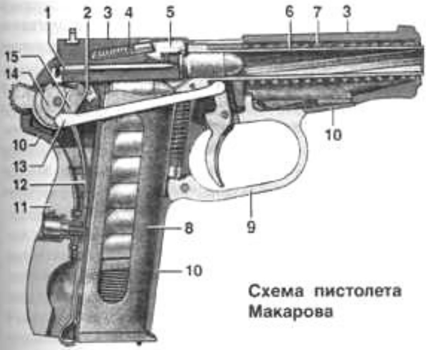
Схема пистолета Макарова