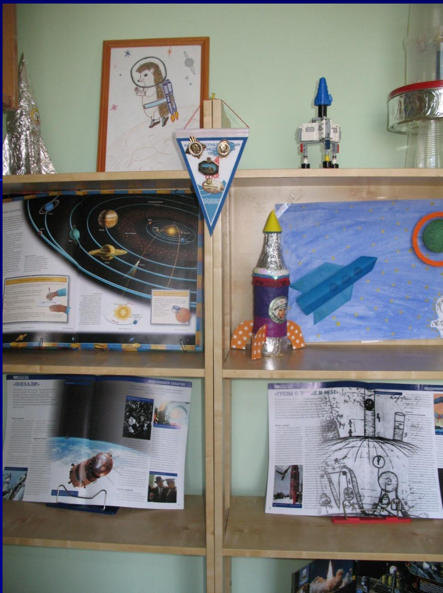
Мини-выставка в 3 классе