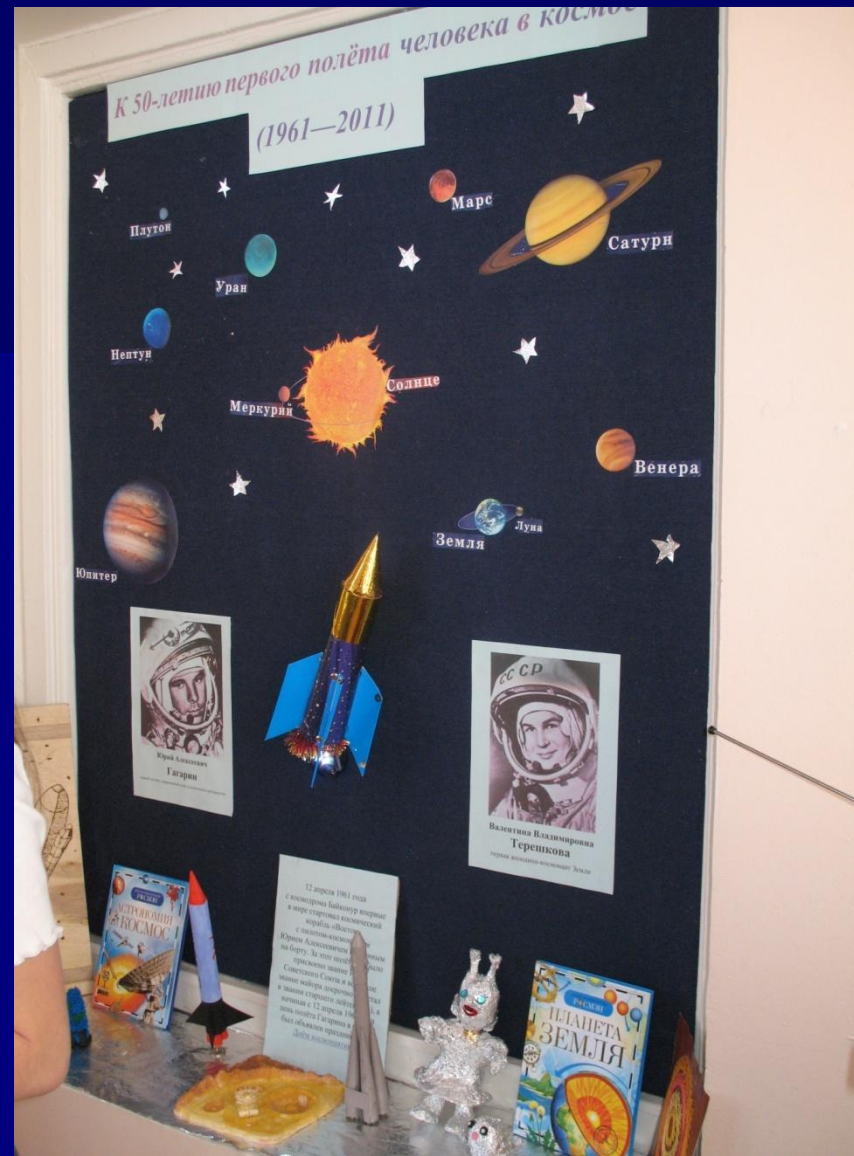
Мини-выставка в 4 классе